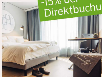
harry's home Zürich-Limmattal