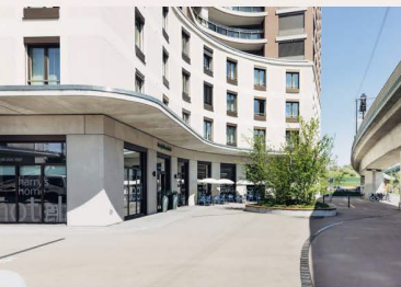
harry's home Zürich-Wallisellen