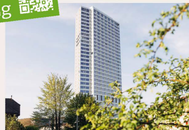
harry's home Bern-Ostermundigen